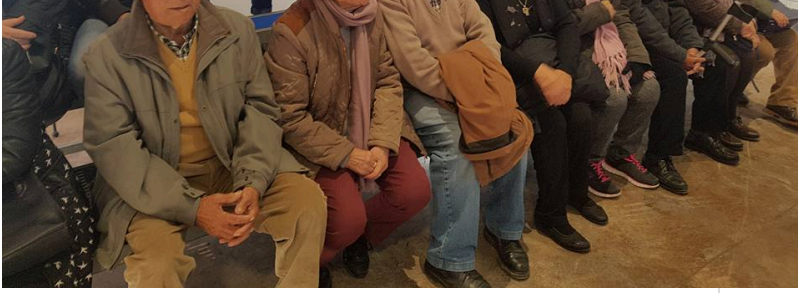
( http://www.chucena.es/export/sites/chucena/es/.galleries/imagenes-noticias/noticias-enero-2017/huerto-ramirez-2017-8.jpg )