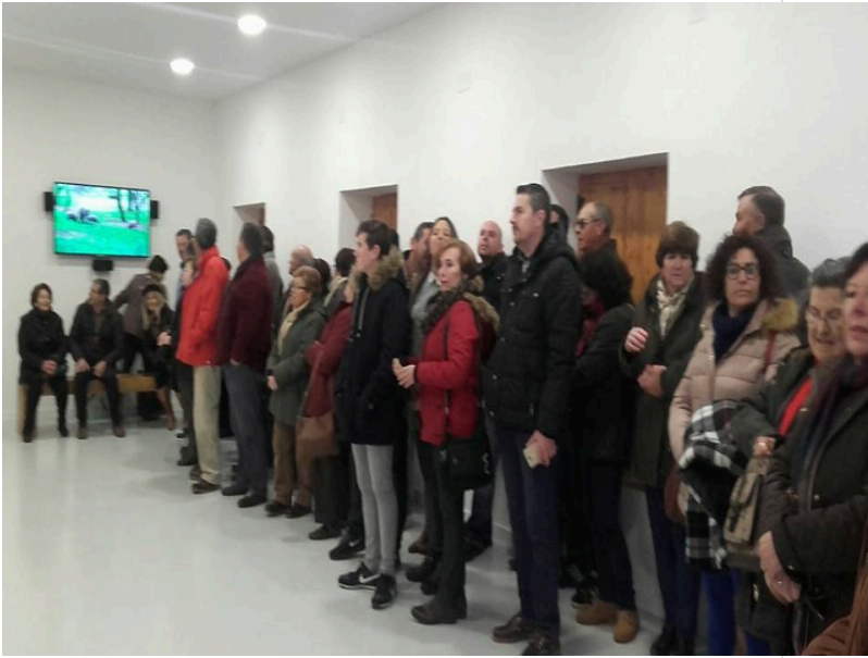
( http://www.chucena.es/export/sites/chucena/es/.galleries/imagenes-noticias/noticias-enero-2017/huerto-ramirez-2017-9.jpg )