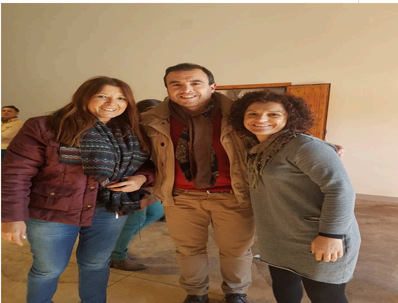
( http://www.chucena.es/export/sites/chucena/es/.galleries/imagenes-noticias/noticias-enero-2017/huerto-ramirez-2017-3.jpg )