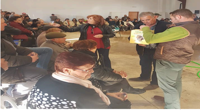
( http://www.chucena.es/export/sites/chucena/es/.galleries/imagenes-noticias/noticias-enero-2017/huerto-ramirez-2017-2.jpg )