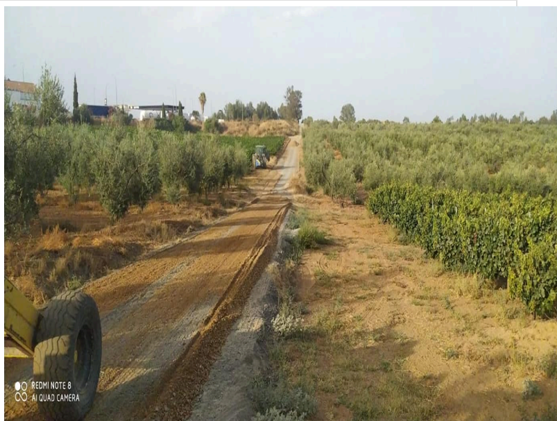
( http://www.chucena.es/export/sites/chucena/es/.galleries/imagenes-noticias/programa-ejecucion-caminos-3.jpg )