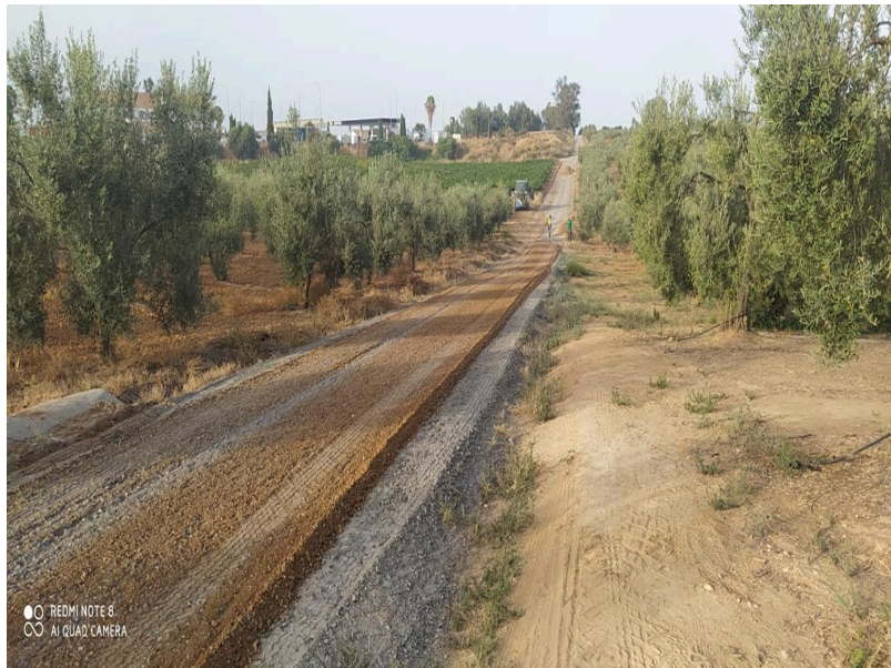
( http://www.chucena.es/export/sites/chucena/es/.galleries/imagenes-noticias/programa-ejecucion-caminos-4.jpg )