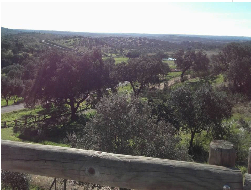
( http://www.chucena.es/export/sites/chucena/es/.galleries/imagenes-noticias/noticias-enero-2017/huerto-ramirez-2017-5.jpg )