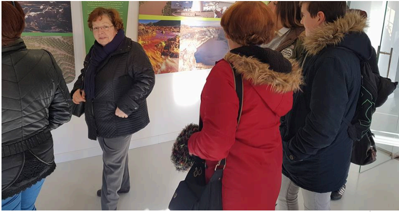
( http://www.chucena.es/export/sites/chucena/es/.galleries/imagenes-noticias/noticias-enero-2017/huerto-ramirez-2017-4.jpg )