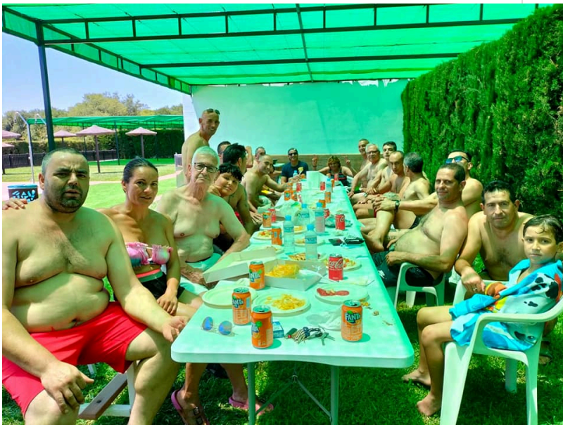
( http://www.chucena.es/export/sites/chucena/es/.galleries/imagenes-noticias/proyecto-hombre-5.jpg )