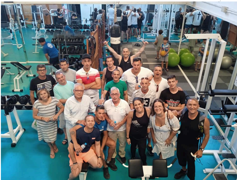
( http://www.chucena.es/export/sites/chucena/es/.galleries/imagenes-noticias/proyecto-hombre-7.jpg )