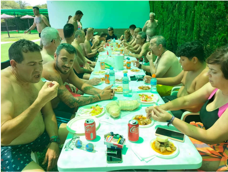
( http://www.chucena.es/export/sites/chucena/es/.galleries/imagenes-noticias/proyecto-hombre-4.jpg )